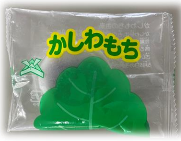
② ピアットかしわもち（葉なし） 30g