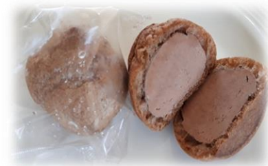
⑦ チョコシュー（FeCa強化） 30g

国産小麦粉を100%使用したシューパフに、鉄・カルシウムを強化したガナッシュクリームを詰めました。