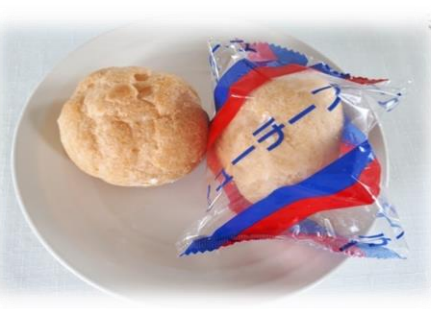
⑥ シューチーズ 30g