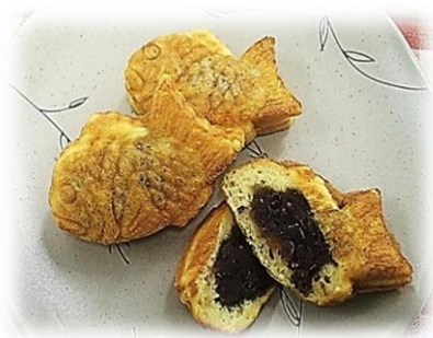
④ プチたい焼き 30g