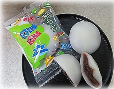
① 港製菓 ミニ柏餅（葉なし） （こし餡） 30g