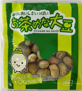
⑤ お茶めな大豆 6g