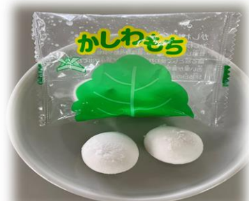
③ ピアット柏餅（葉なし） （粒餡） 10g × 2粒入